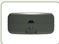
Port USB ke PC