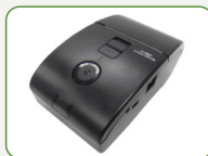
Printer Portabel (opsional)