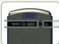
Print Wireless dengan port IR